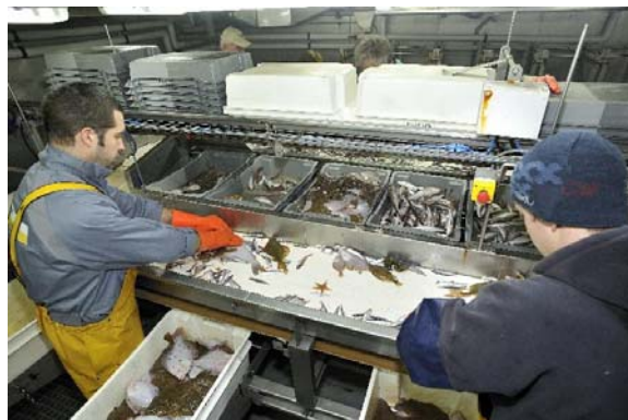
© Ifremer/Olivier Dugornay – IBTS 2010