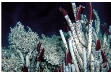
© Ifremer-Nautile/ Phare, dorsale du Pacifique oriental - Vers géants Riftia pachyptila

Liaison vidéo en direct avec l'équipe de la campagne BIG sur L'Atalante Le 7 juin à l'Océanopolis, Brest