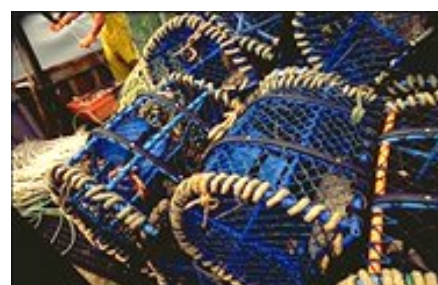
© Ifremer/ Olivier Barbaroux - Bretagne